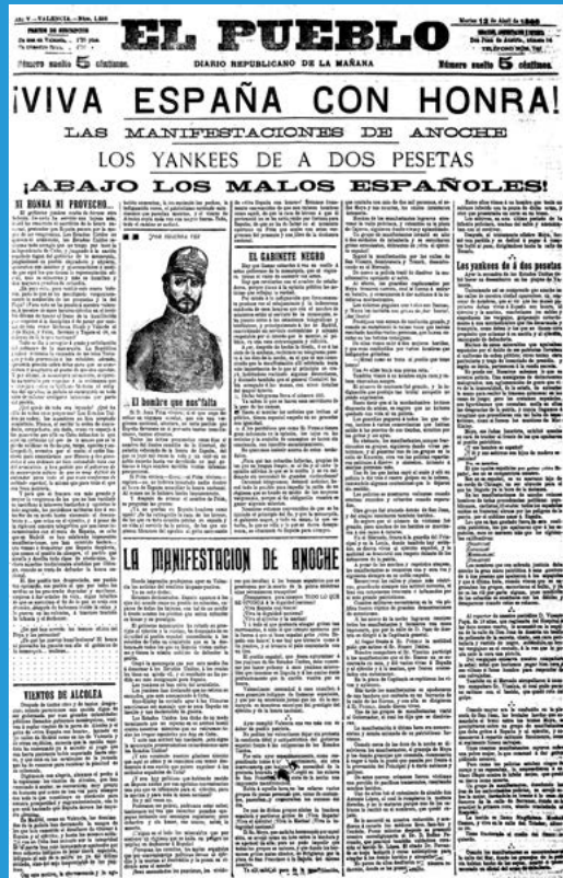
Article reivindicatiu en El Poble Biblioteca Valenciana Nicolau Primitiu

Pensant en ells, però també en el seu benefici personal, va desplegar amb afany la tasca d' editor . Calia educar els més desfavorits, permetent-los l'accés a totes les matè-