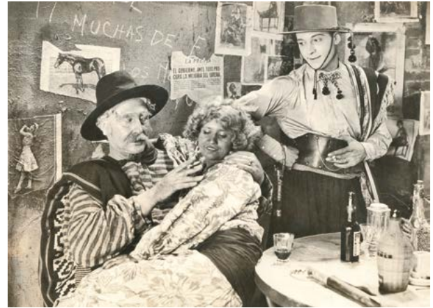
Escena de la pel·lícula The Four Horsemen of the Apocalypse (1921) Biblioteca Valenciana Nicolau Primitiu

Mercés al seu prestigi internacional, se li va oferir l'opunitat de fer la volta al món a bord d'un luxós transatlàntic. Viatjaria amb totes les despeses pagades, i a canvi deixaria constància de les meravelles contemplades en els més remots racons en uns articles que, posteriorment, van passar a formar part de La vuelta al mundo de un novelista .