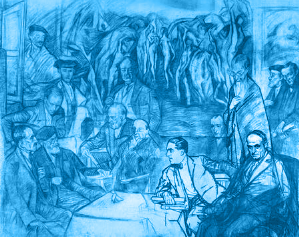
Els meus amics d'Ignacio Zuloaga Museu Zuloaga de Zumàia

La verdadera arrancada de la seua trajectòria Blasco la situava en les seues novel·les valencianes, i des de llavors els escenaris dels seus relats es van anar eixamplant. Així, poden reconèixer-se en la seua obra diverses etapes: