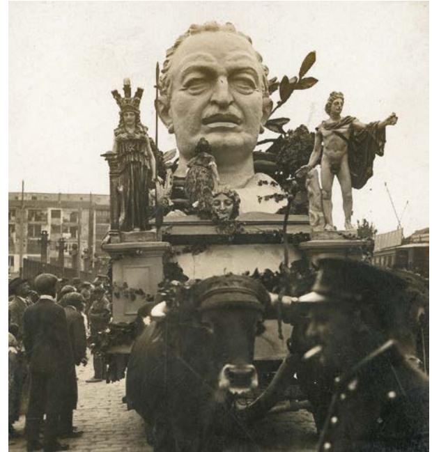
Carrossa amb un bust de Vicente Blasco Ibáñez en la cavalcada que es va celebrar a València amb motiu de la seua visita el 15 de maig de 1921

En els braços de la fama va viure el novel·lista, a la Costa Blava, els seus últims anys, erigit en un ostentós milionari que, malgrat tot, mai va renunciar a dedicar-se al que millor sabia fer: escriure. La seua inquieta fantasia li suscitava contínuament nous projectes. Alguns no els va poder complir. Tampoc va veure com tres anys després de la seua mort es