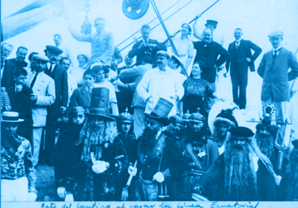
Blasco Ibáñez disfressat en un vaixell, amb motiu de la festa del pas de l'Equador