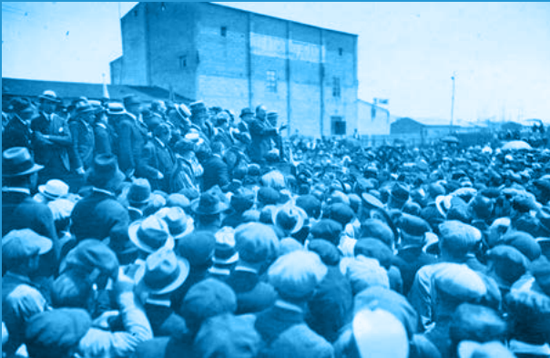
Blasco Ibáñez a un míting. En estos actes públics l'escriptor tenia gran poder de convocatòria

Com a resposta a la seua visió de la vida, essencialment trista, Blasco Ibáñez aconsellava que l'orquestra que tots portem dins interpretara simfonies distintes. Era una manera de mantindre viva la il·lusió. Potser per això ell es va multiplicar en activitats i empreses diferents, en un clar intent per reivindicar-se, al mateix temps que pretenia difondre els seus ideals.