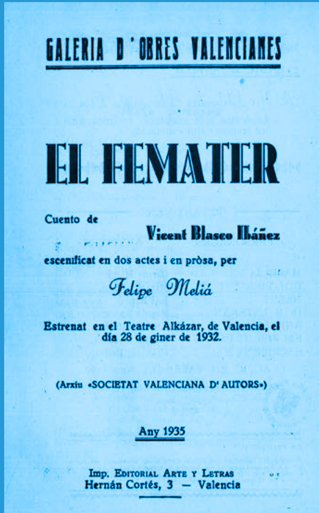
Biblioteca Valenciana Nicolau Primitiu.