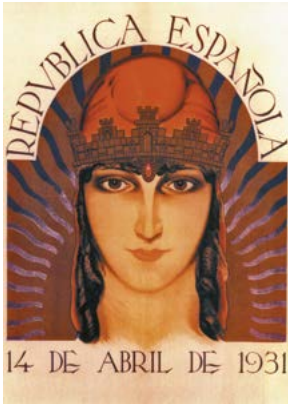
Tres años después de la muerte del novelista, se proclamó la Segunda República que él había anhelado tanto

Progreso. Con su indiscutible capacidad oratoria y su habilidad para organizar la participación popular en su partido, logró liderar a los grupos más populares de la provincia, lo que le permitió obtener el escaño en varias legislaturas.