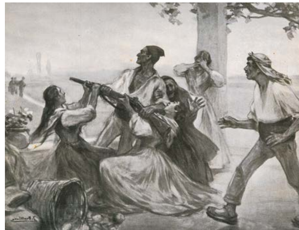
Ilustración de José Benlliure En: La barraca. Valencia: Prometeo, 1921, p. 29. Biblioteca Valenciana Nicolau Primitiu. Fondo Bas Carbonell