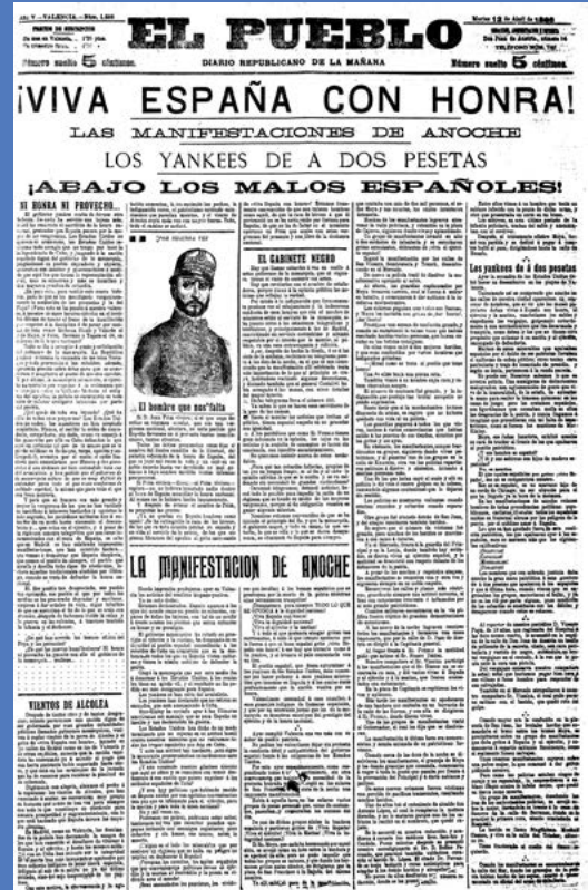
Artículo reivindicativo en El Pueblo Biblioteca Valenciana Nicolau Primitiu

Pensando en ellos, pero también en su beneficio personal, se desempeñó asimismo con ahínco en la tarea