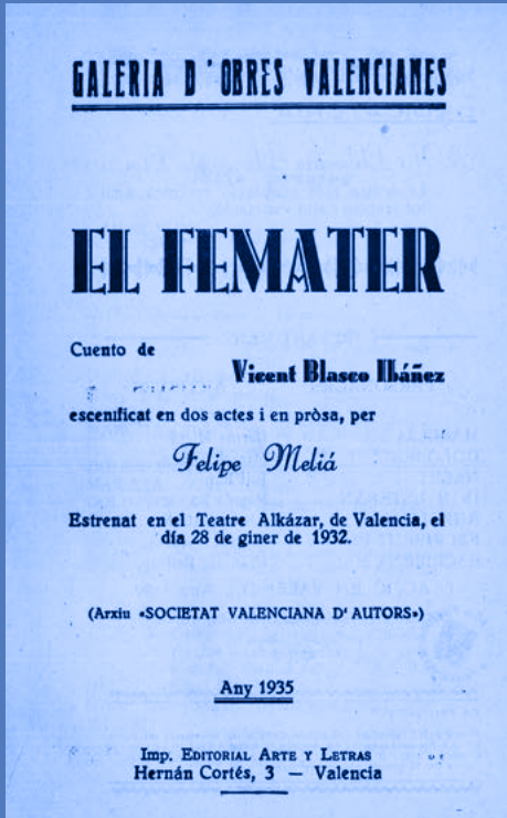
Biblioteca Valenciana Nicolau Primitiu.

La trayectoria exitosa de Blasco Ibáñez quedó refrendada por las multitudinarias acogidas que le dispensaban en cualquier lugar adonde llegaba. Pero sus triunfos también despertaron el resentimiento y la envidia en sus adversarios políticos o en los escritores contemporáneos que apenas podían competir en cifras de ventas de sus obras. Aun así, tanto en vida del escritor como poco después de su muerte, su producción literaria alcanzó unas cotas de difusión impresionantes.