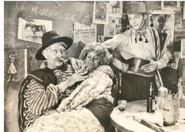
Escena de la película The Four Horsemen of the Apocalypse (1921) Biblioteca Valenciana Nicolau Primitiu

Merced a su prestigio internacional, se le ofreció la oportunidad de dar la vuelta al mundo a bordo de un lujoso trasatlántico. Viajaría con todos los gastos pagados, y a cambio dejaría constancia de las maravillas contempladas en los más remotos rincones en unos artículos que, posteriormente, pasaron a formar parte de La vuelta al mundo de un novelista .