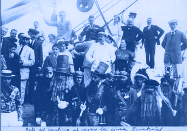
Blasco Ibáñez disfrazado en un barco, con motivo de la fiesta del paso del Ecuador