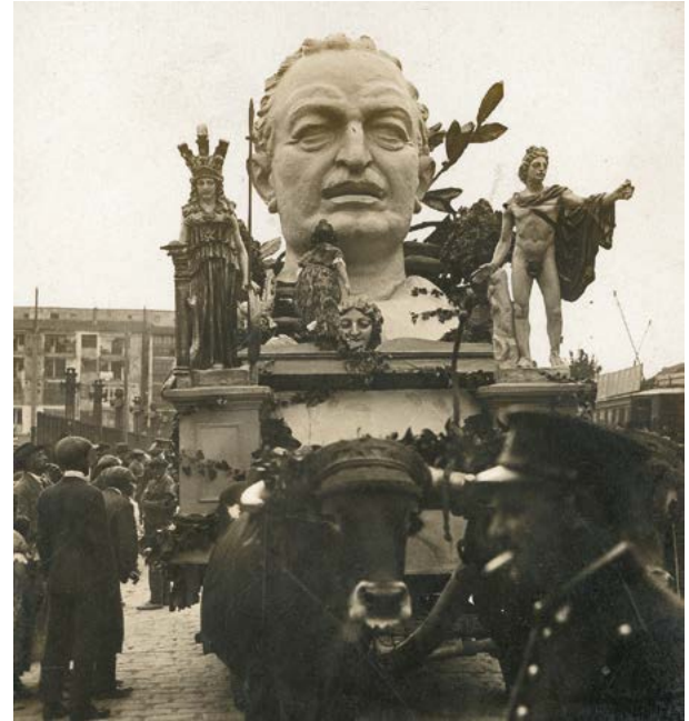
Carroza con un busto de Vicente Blasco Ibáñez en la cabalgata que se celebró en Valencia con motivo de su visita el 15 de mayo de 1921

En los brazos de la fama vivió el novelista, en la Costa Azul, sus últimos años, erigido en un ostentoso millonario que, aun así, nunca renunció a dedicarse a lo que mejor sabía hacer: escribir. Su inquieta fantasía le suscitaba continuamente nuevos proyectos. Algunos no los pudo cumplir. Tampoco vio cómo tres años después de su muerte se proclamaba la Segunda República por la que tanto había luchado.