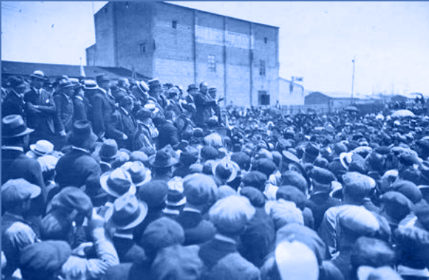
Blasco Ibáñez en un mitin. En estos actos públicos el escritor tenía gran poder de convocatoria

Como respuesta a su visión de la vida, esencialmente triste, Blasco Ibáñez aconsejaba que la orquesta que todos llevamos dentro interpretase sinfonías distintas. Era una manera de mantener viva la ilusión. Quizá por ello él se multiplicó en actividades y empresas distintas, en un claro intento por reivindicarse, a la vez que pretendía difundir sus ideales.