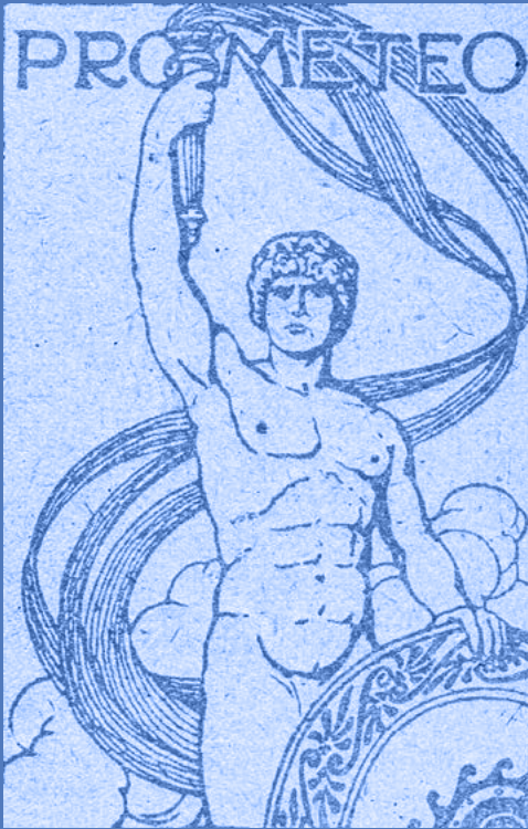
Logotipo de la editorial Prometeo Biblioteca Valenciana Digital