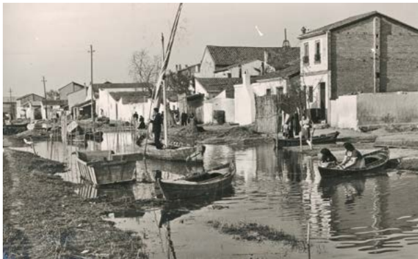
Fotografía de El Palmar, donde está ambientada la novela Cañas y barro (1902)