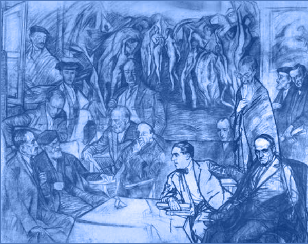
Mis amigos de Ignacio Zuloaga Museo Zuloaga de Zumaiá

Por aquel entonces primaba en él la herencia romántica y la tendencia folletinesca. Años después, el propio novelista repudiaría tales historias.